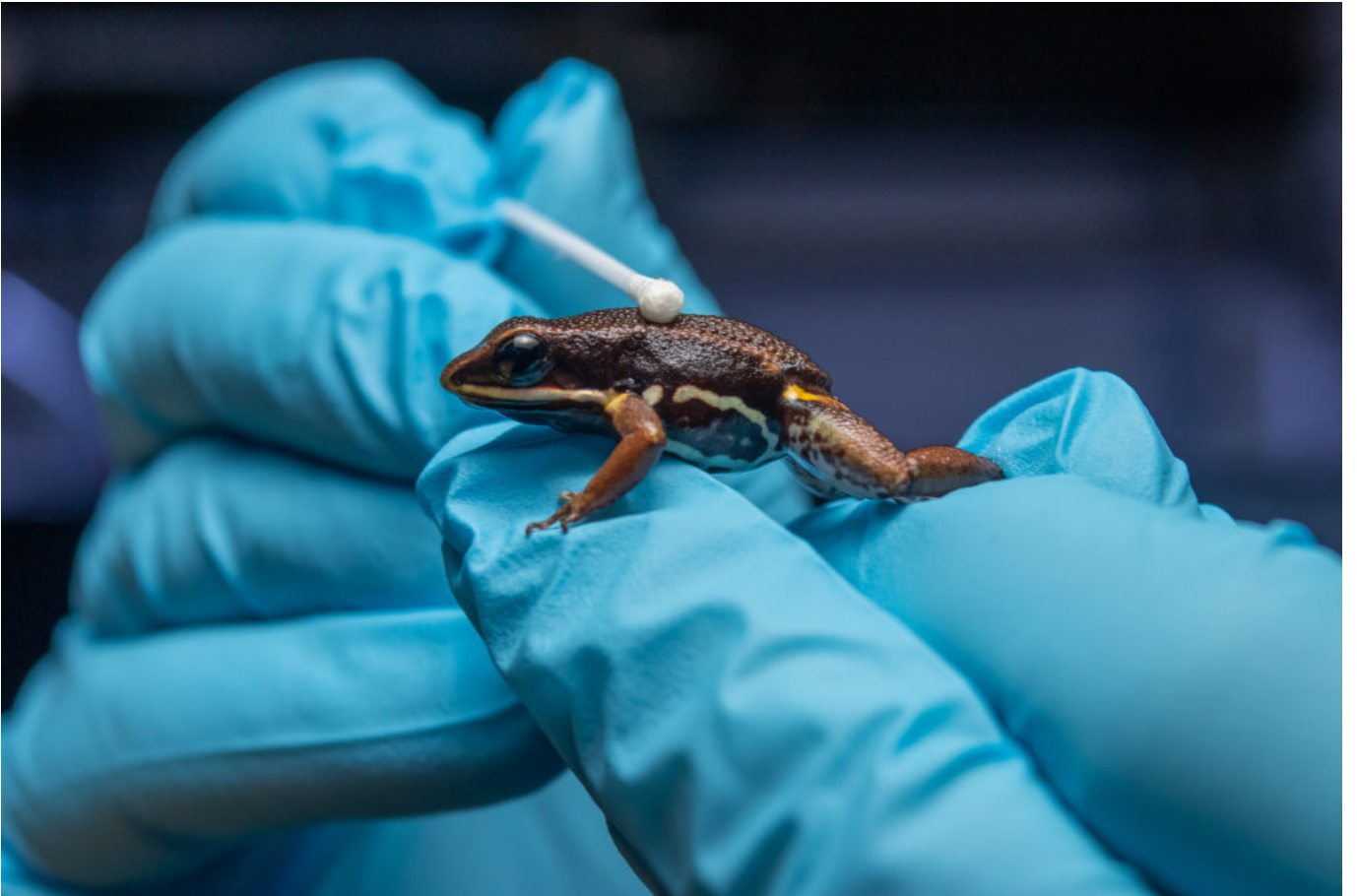
« Frog Swabbing » par Francesca Angiolani-Larrea, Université de Berne