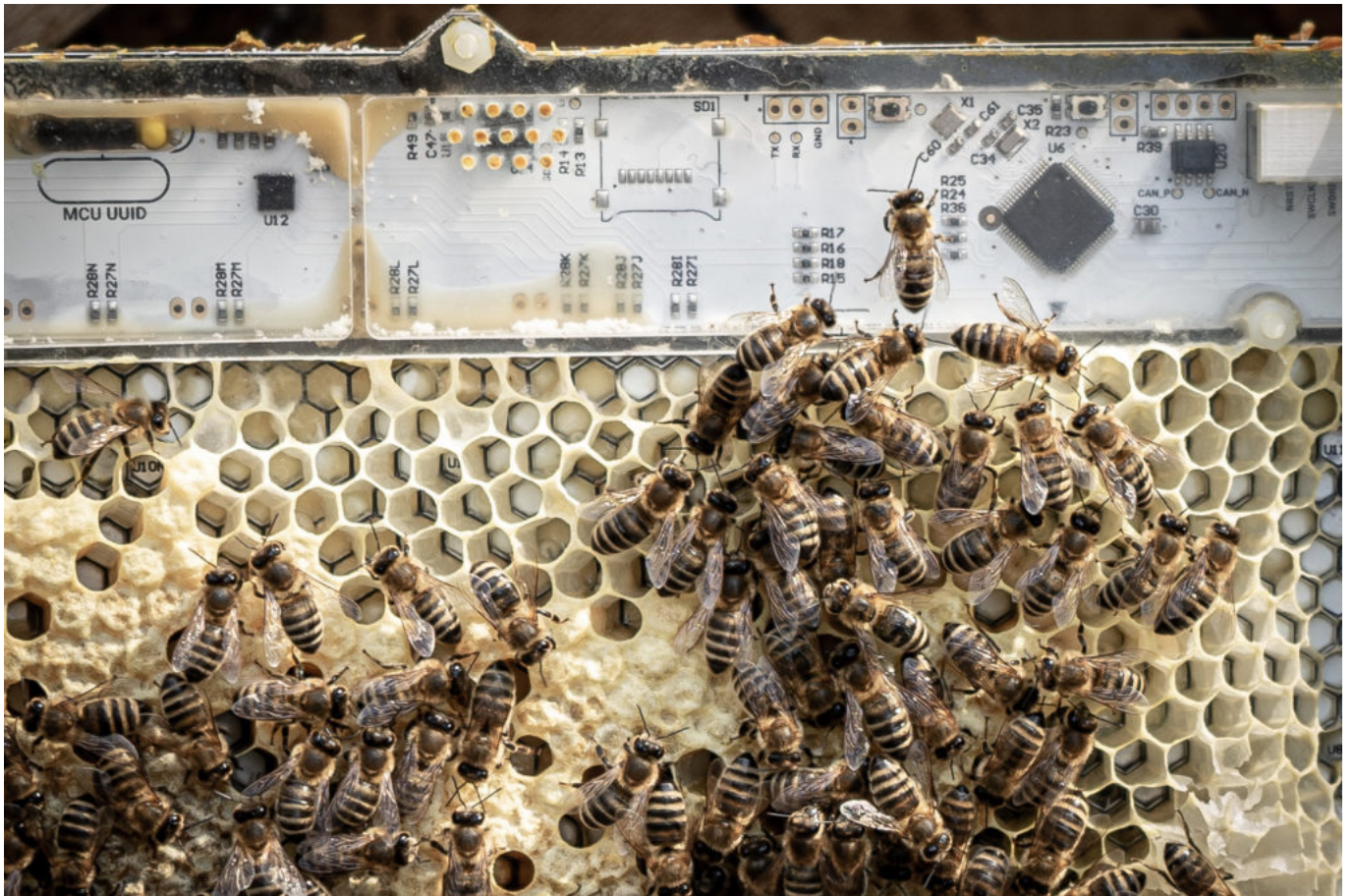
« Bees and chips » par Rafael Barmak, EPFL