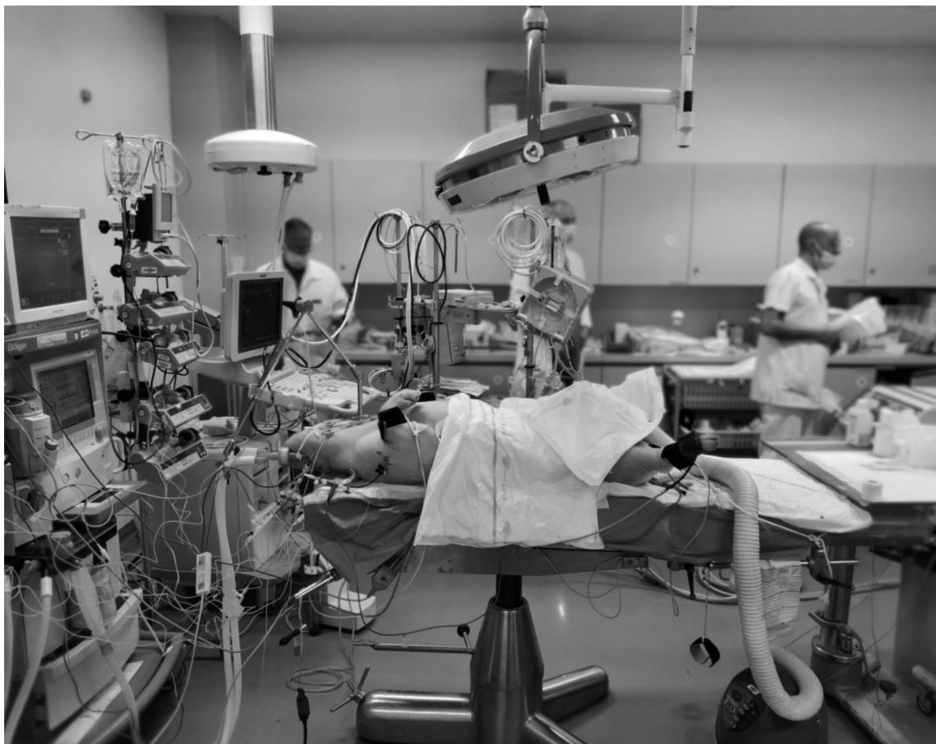
« Organized Chaos » par Georgios Rovas, EPFL

Une galerie en ligne met à disposition gratuitement l'ensemble des images soumises à ce jour au concours, soit près de 2800 oeuvres.