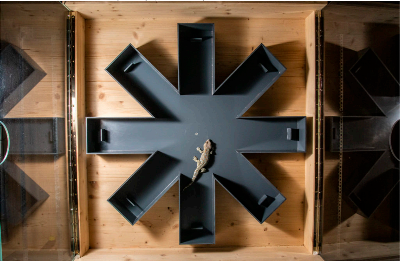
« Cognition roulette », par Francesca Angiolani-Larrea, Université de Berne