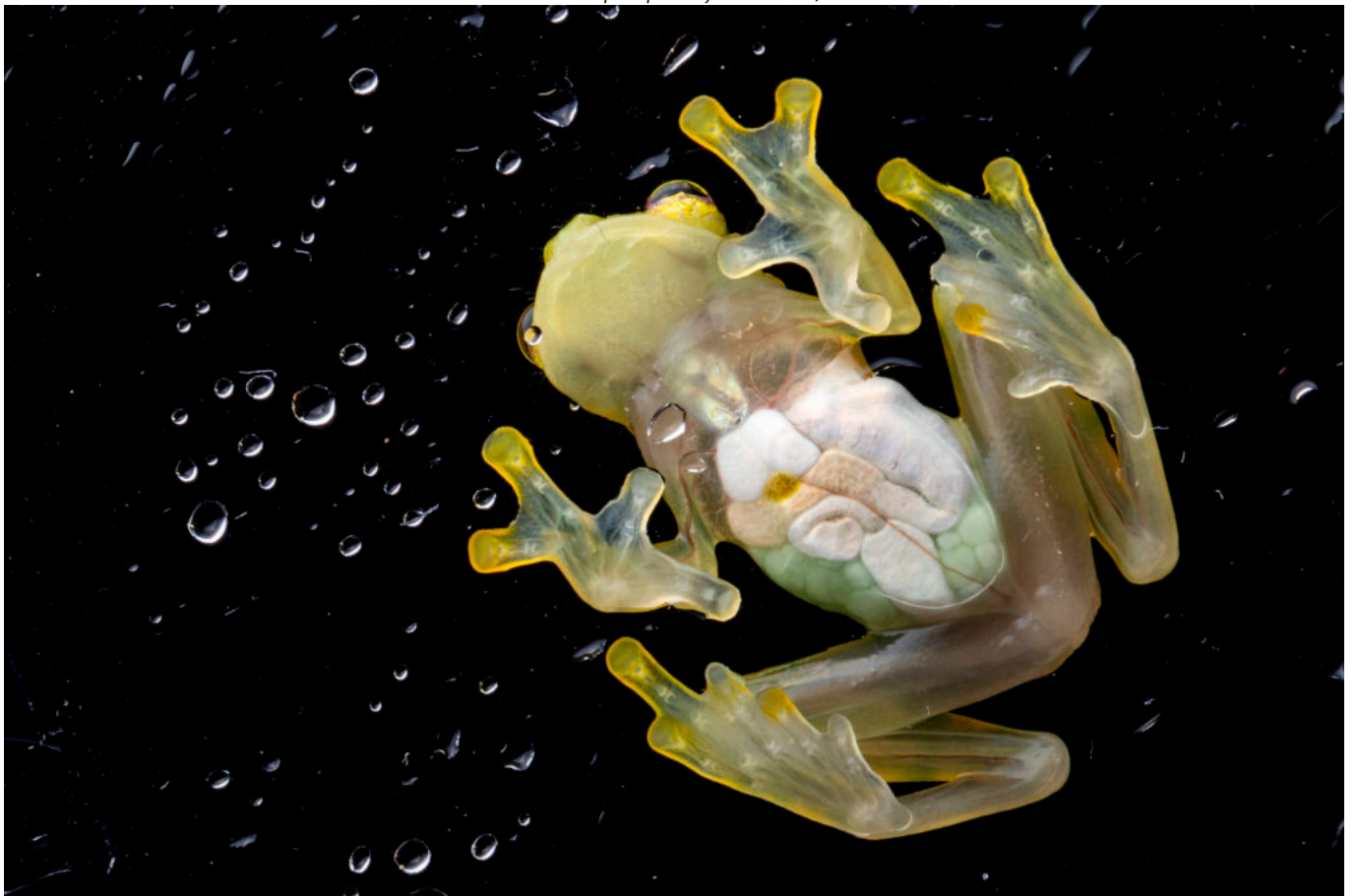
« Searching for a good father » par Francesca Angiolani-Larrea, Université de Berne