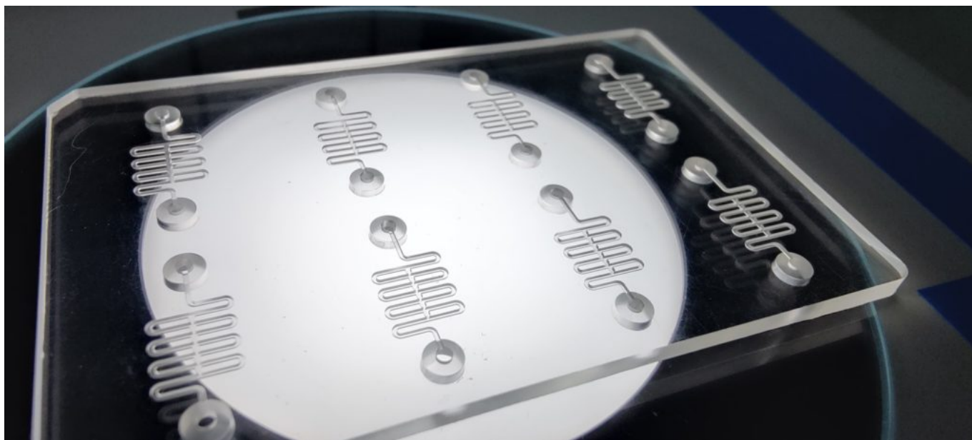
Organe sur puce

Cette expérience reproduisait la fonction d'une alvéole pulmonaire qui transfère l'oxygène de l'air vers le sang. Le dispositif se composait de deux canaux microfluidiques permettant de faire circuler des fluides à très petite échelle et qui étaient séparés par une membrane. D'un côté de la puce, se trouvaient une couche de cellules épithéliales de poumon en contact avec de l'air et de l'autre, une couche de cellules endothéliales de veines dans un liquide. Sur le côté, des dispositifs étiraient cette membrane pour mimer les actions d'inspiration et d'expiration. Le système a bien permis de reproduire la respiration d'une alvéole pulmonaire, mais il ne ressemblait pas du tout à un poumon.