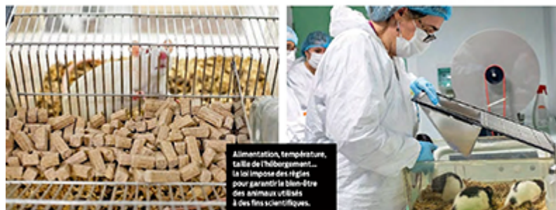
Alimentation, température, taille de l'hébergement... la loi impose des règles pour garantir le bien-être des animaux utilisés à des fins scientifiques.

>>> Ces différences expliquent certains échecs de l'expérimentation animale. S'agissant des médicaments, seuls 10% de ceux qui semblent prometteurs à ce stade seront finalement commercialisés à l'issue des essais cliniques chez l'homme. Toujours est-il que rongeurs et consorts jouent un rôle de filtre en amont : parmi 10 molécules testées sur eux, une seule sera finalement sur des patients. Plus largement, tous les chercheurs s'accordent à dire que le modèle animal sera encore indispensable pendant longtemps dans certains domaines, en particulier ceux où intervient de façon complexe différents organes. Exemples : les interactions entre le cerveau, l'intestin et le microbiote, ou bien la manière dont les perturbateurs endocriniens influencent le fonctionnement de certains systèmes hormonaux. « Pour ce qui touche à la réponse immunitaire est aussi très difficile à étudier autrement que chez l'animal », souligne Xavier Gidrol. Or les enjeux sont colossaux : maladies infectieuses, auto-immunes, inflammation... On peut également citer bien entendu, toutes les études comportementales.